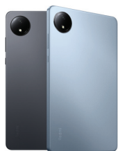
Redmi Pad SE 8.7 - 4G (4GB/64GB)

XMI-6941812793435 (Graphite Gray) XMI-6941812794197 (Sky Blue)