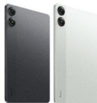
Redmi Pad Pro 5G (8GB/128GB)

XMI-6941812785430 (Mint Green) XMI-6941812785522 (Graphite Gray)