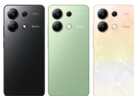
Redmi Note 13 (8GB/256GB)

XMI-6941812759509 (Midnight Black) XMI-6941812762356 (Mint Green) XMI-6941812762455 (Ocean Sunset)