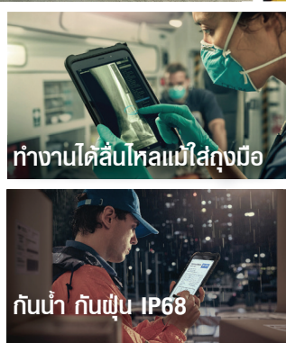
ทำงานได้สัมผัสแทบไม่สึกขรุขระ