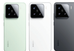
Xiaomi 15 (12GB/256GB)

XMI-6941812790427 (Black) XMI-6941812790496 (Purple)