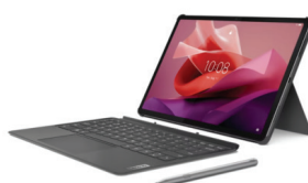
TAB P12 TB-370FU (Wifi)