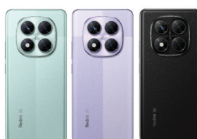
Redmi Note 14 Pro 5G (12GB/256GB)

XMI-6932554404499 (Coral Green) XMI-6932554404772 (Lavender Purple) XMI-6932554402983 (Midnight Black)