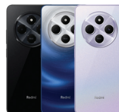
Redmi 14C (8GB/256GB)

XMI-6941812798102 (Midnight Black) XMI-6941812787663 (Stary Blue) XMI-6941812749104 (Dreamy Purple)