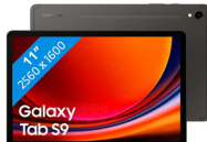
Samsung Galaxy Tab S9 WIFI (8/128GB)

SSG-PSMX710NZAATHL (Graphite) SSG-PSMX710NZEATHL (Beige)