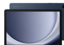
Samsung Galaxy Tab A9+ 5G (8/128GB)

SSG-PSMX216BZSETHL (Silver) SSG-PSMX216BDBETHL (Navy)