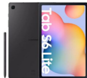
Samsung Galaxy Tab S6 Lite 4/128GB (Model 2024)

SSG-PSMP625NZAETHL (Gray) SSG-PSMP625NLGETHL (Light Mint)