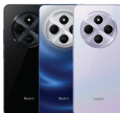
Redmi 14C (6GB/128GB)

XMI-6941812776667 (Midnight Black) XMI-6941812780626 (Ocean Blue) XMI-6941812780138 (Pearl Pink)