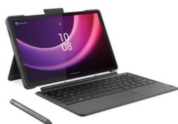
TAB P11 2nd gen TB-350XU (4G Data)