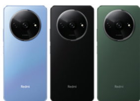
Redmi A3 (3GB/64GB)

XMI-6941812765043 (Midnight Black) XMI-6941812766767 (Forest Green) XMI-6941812766620 (Star Blue)