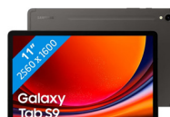
Samsung Galaxy Tab S9 5G (8/128GB)

SSG-PSMX716BZAATHL (Graphite) SSG-PSMX716BZEATHL (Beige)