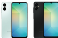
Samsung Galaxy A06 5G (6GB/128GB)

SSG-PSMA066BZKHTL (Black) SSG-PSMA066BLGHTL (Light Green)