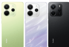
Redmi Note 14 (8GB/256GB)

XMI-6941812759509 (Midnight Black) XMI-6941812762356 (Mint Green) XMI-6941812762455 (Ocean Sunset)