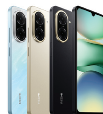
Redmi A5 (4GB/128GB)

XMI-6932554425289 (Ocean Blue) XMI-6932554425449 (Sandy Gold) XMI-6932554425111 (Midnight Black)