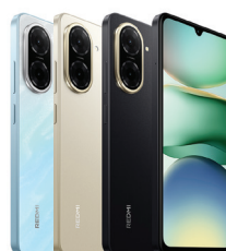
Redmi A5 (3GB/64GB)

XMI-6941812765043 (Midnight Black) XMI-6941812766767 (Forest Green) XMI-6941812766620 (Star Blue)