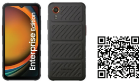
Samsung Galaxy Xcover 7 EE 5G