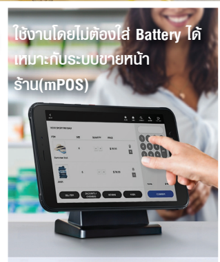
ใช้งานโดยไม่ต้องใส่ Battery ได้ เหมาะกับระบบขายหน้า ร้าน(mPOS)