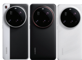
Xiaomi 15 Ultra (16GB/512GB)

XMI-6932554406141 GRN XMI-6932554406097 BLK XMI-6932554405809 WHT