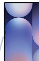
Samsung Galaxy Tab S10 Ultra (12GB/512GB) 5G