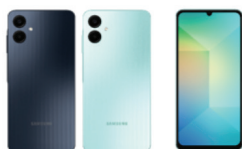
Samsung Galaxy A06 (4GB/64GB , 4GB/128GB)

SSG-PSMA065FZKDTL (Black) SSG-PSMA065FLGDTL (Green) SSG-PSMA065FZKDTL (Black) SSG-PSMA065FLGDTL (Green)