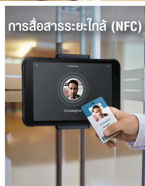
การสื่อสารระยะใกล้ (NFC)