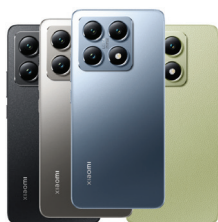
Xiaomi 14T (12GB/256GB)

XMI-6941812711385 (Titan Black) XMI-6941812710470 (Titan Blue) XMI-6941812711804 (Titan Gray) XMI-6941812711347 (Lemon Green)