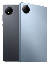
Redmi Pad SE 8.7 - 4G (6GB/128GB)

XMI-6941812793435 (Graphite Gray) XMI-6941812794197 (Sky Blue)