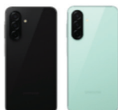
Samsung Galaxy A26 5G (8GB/256GB)

SSG-PSMA266BZKHTL (Black) SSG-PSMA266BLGHTL (Light Green)