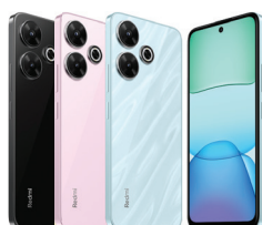
Redmi 13 (8GB/256GB)

XMI-6941812776667 (Midnight Black) XMI-6941812780626 (Ocean Blue) XMI-6941812780138 (Pearl Pink)