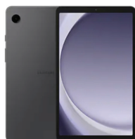
Samsung Galaxy Tab A9 (4/64GB) LTE