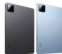
Xiaomi Pad 7 PRO (12/512)

XMI-6932554415853 BLU XMI-6932554415952 GRY