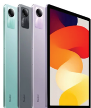
Redmi Pad SE

XMI-6941812756768 (Lavender Purple) XMI-6941812756799 (Mint Green) XMI-6941812756447 (Graphite Gray) XMI-6941812756416 (Graphite Gray) XMI-6941812756607 (Lavender Purple) XMI-6941812756478 (Lavender Purple) XMI-6941812756669 (Mint Green) XMI-6941812756683 (Graphite Gray) XMI-6941812756522 (Mint Green)