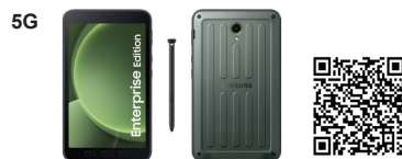
Samsung Galaxy Tab Active5 EE 5G

SSG-PSMX306BZGAS06 (Green) SSG-PSMX306BZGES06 (Green)