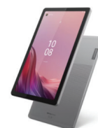
TAB M9 TB-310XU (4G ไนร์ด)