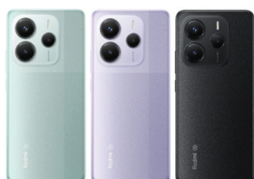
Redmi Note 14 5G (12GB/512GB)

XMI-6932554404499 (Coral Green) XMI-6932554404772 (Lavender Purple) XMI-6932554402983 (Midnight Black)