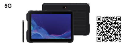
Samsung Galaxy Tab Active 4 Pro EE 5G

SSG-PSMX306BZGAS06 (Green) SSG-PSMX306BZGES06 (Green)