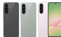
Samsung Galaxy A56 5G (8GB/128GB , 12GB/256GB)

SSG-PSMA566BZKSTL (Black) SSG-PSMA566BZGSTL (Green) SSG-PSMA566BLISTL (Light Pink) SSG-PSMA566BZKSTL (Black) SSG-PSMA566BZGSTL (Green) SSG-PSMA566BLIUTL (Light Pink)