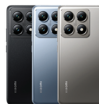
Xiaomi 14T Pro (12GB/512GB)

XMI-6941812798881 (Titan Black) XMI-6941812798966 (Titan Blue) XMI-6941812798973 (Titan Gray) XMI-6941812798898 (Lemon Green)