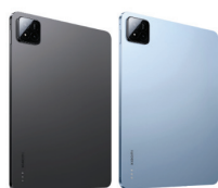
Xiaomi Pad 7 (8/256)

XMI-6932554417093 BLU XMI-6932554416706 GRY