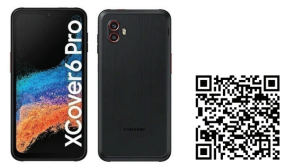
Samsung Galaxy Xcover 6 Pro EE 5G