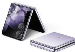
Xiaomi Mix Flip (12GB/512GB)

XMI-6941812789377 (Titan Black) XMI-6941812789230 (Titan Blue) XMI-6941812789155 (Titan Gray)