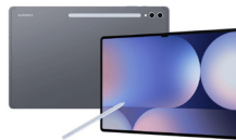
Samsung Galaxy Tab S10 FE+ WIFI 8/128GB , 12/256GB

SSG-PSMX526BZAATHL(Gray) SSG-PSMX526BLBATHL(Blue)