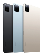
Redmi Pad Pro (8GB/256GB)

XMI-6941812794555 (Graphite Gray) XMI-6941812793572 (Sky Blue)