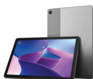
TAB M10 TB-328XU (4G ไนร์ด)