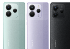
Redmi Note 14 5G (8GB/256GB)

XMI-6932554408442 (Lime Green) XMI-6932554407780 (Midnight Black) XMI-6932554408572 (Mist Purple)