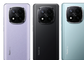
Redmi Note 14 Pro+ 5G (12GB/512GB)

XMI-6932554402150 (Coral Green) XMI-6932554402396 (Lavender Purple) XMI-6932554402907 (Midnight Black)