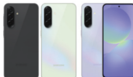
Samsung Galaxy A36 5G (8GB/128GB)

SSG-PSMA366BZKSTL (Black) SSG-PSMA366BLGSTL (Light Green) SSG-PSMA366BLVSTL (Light Violet)