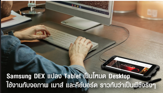
Samsung DEX แปลง Tablet เป็นโหมด Desktop ใช้งานกับจอภาพ เมาส์ และคีย์บอร์ด ราวกับว่าเป็นพีซีจริงๆ

มีโหมด No Battery สลับไปใช้พลังงานจากแหล่งจ่ายไฟตรง โดยไม่ผ่านแบตเตอรี่ของตัวเครื่อง