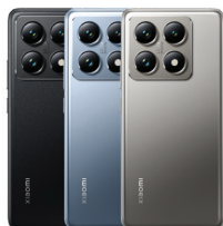
Xiaomi 14T Pro (12GB/1TB)

XMI-6941812789377 (Titan Black) XMI-6941812789230 (Titan Blue) XMI-6941812789155 (Titan Gray)