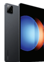
Xiaomi Pad 6S Pro (8GB/256GB)

XMI-6941812785430 (Mint Green) XMI-6941812785522 (Graphite Gray)