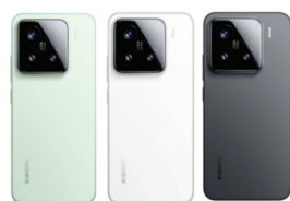
Xiaomi 15 (12GB/512GB)

XMI-6932554406141 GRN XMI-6932554406097 BLK XMI-6932554405809 WHT