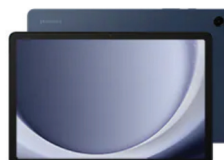
Samsung Galaxy Tab A9+ WIFI (8/128GB)

SSG-PSMX210NZSETHL (Silver) SSG-PSMX210NDBETHL (Navy)