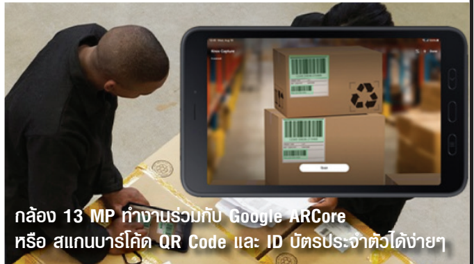
กล้อง 13 MP ทำงานร่วมกับ Google ARCore หรือ สแกนบาร์โค้ด QR Code และ ID บัตรประชาชนได้ต่างๆ